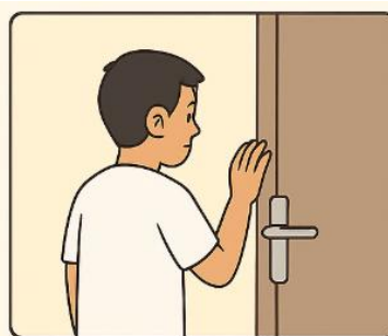
Mengetuk pintu terlebih dahulu