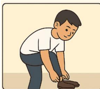
Melepas alas kaki dan menatanya dengan rapi